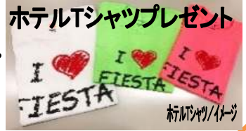
ホテルTシャツプレゼント