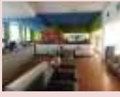
レアアラウンジイメージ